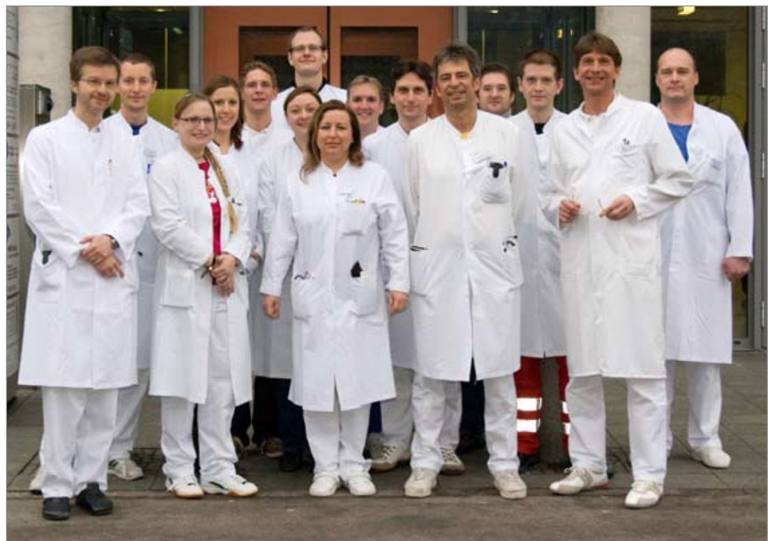
Das kompetente Ärzte-Team des Wörther Krankenhauses übernimmt Verantwortung für die Portalklinik.

Durch die Vor-Ort-Tätigkeit der Wörther Chef-, Ober- und Assistenzärzte werden die Behandlungsmöglichkeiten von Wörth aus zum Teil auf Hemau übertragen. In der Regelarbeitszeit sind deswegen ab dem 1. April 2011 jeweils ein qualifizierter Assistenzarzt und ein Facharzt präsent. Außerhalb der Dienstzeiten wird eine durchgängige Versorgung durch einen Bereitschaftsdienst sichergestellt sein. Parallel zu den in Wörth vorhandenen Schwerpunkten werden künftig auch in Hemau die Bereiche Kardiologie, Gastroenterologie sowie Pneumologie/Allergologie an-